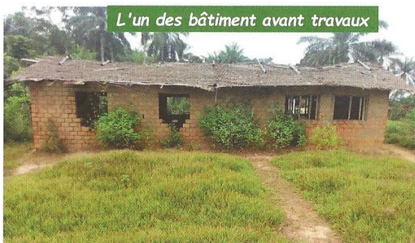
L'un des bâtiment avant travaux

Nous avons pu envoyer un conteneur à la Vie Nouvelle qui vient de nous en faire le rapport.