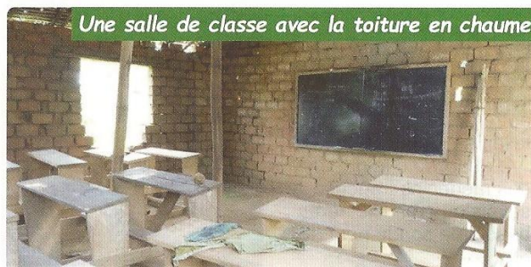
Une salle de classe avec la toiture en chaume

que la gratuité des écoles ait été mise en place depuis la rentrée 2019, ce sont les parents d'élèves qui prennent en charge les salaires impayés pour conserver leurs enseignants..