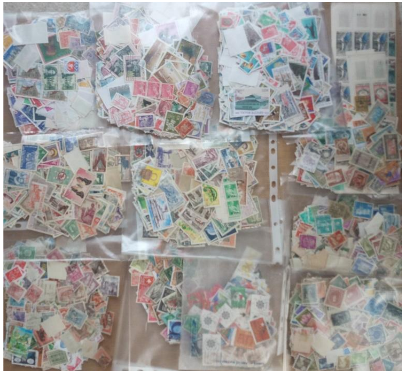
Un exemple de don

Un grand merci à tous les généreux donateurs qui sont chacun un maillon indispensable de la chaîne de solidarité sans lequel nous ne pourrions rien réaliser.